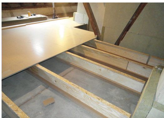
DämmRaum 28 cm