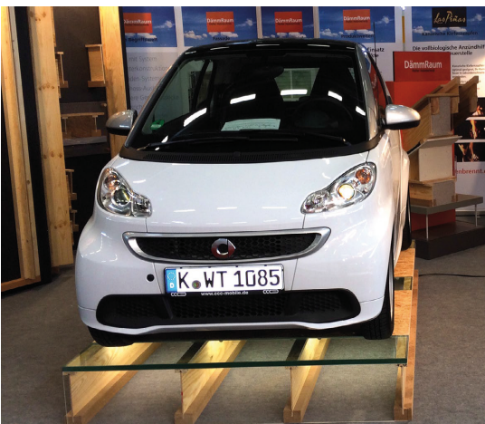
Starker Auftritt 250 kg/m 2