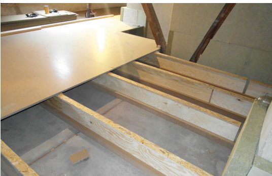
DämmRaum 28 cm

Schlankes Stecksystem als Unterkonstruktion zur Dämmung der oberen Geschosdecke mit nicht druckbelastbaren Dämmstoffen